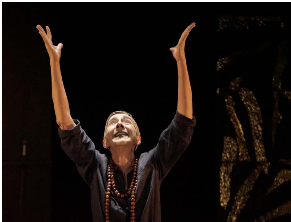
Oreste