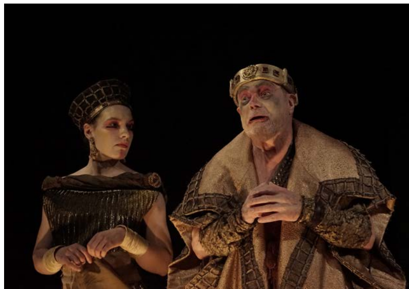
Oreste, création 2019