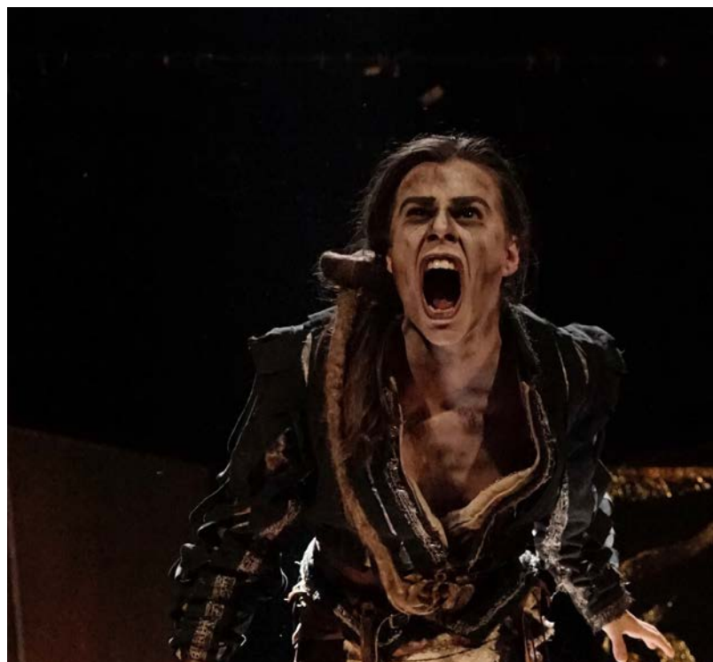
Oreste, création 2019

La Fox Compagnie tend vers un travail scénique très visuel, contribuant ainsi à donner goût au spectacle vivant, notamment auprès du jeune public.